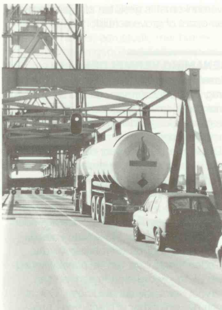
Schade kan veroorzaakt worden door de aard van gevaarlijke stoffen

Daarnaast kan ook onder het begrip schade worden gerekend de kosten die gemaakt worden om bij een ongeval erger te voorkomen en de rente die berekend wordt over het bedrag van de schade tot het moment dat de schade zal worden vergoed. Tenslotte kan tot de schade worden gerekend eventuele kosten van artsen en ziekenhuizen en mogelijk waardeverlies.