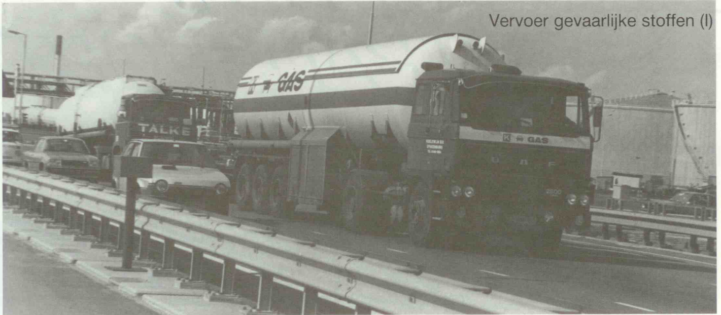
Vervoer gevaarlijke stoffen (I)